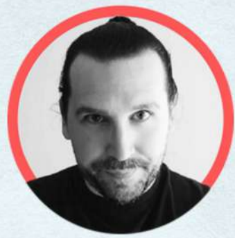
Julien Cortesi @juliencortesi